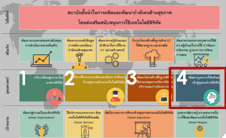
แผนภาพ 2 : แผนพัฒนาดิจิทัลเพื่อเศรษฐกิจและสังคม สถาบันพระบรมราชชนก(2561-2564)