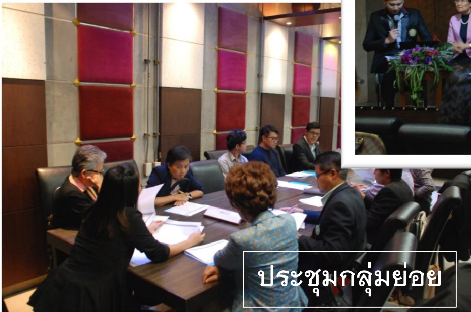
ประชุมกลุ่มย่อย