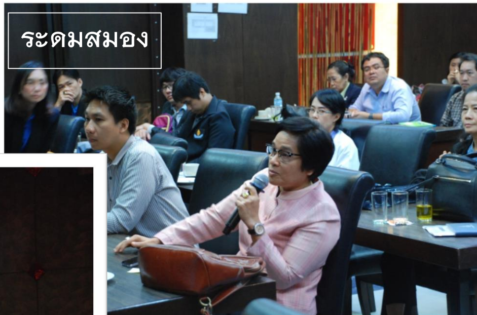
ระดมสมอง